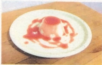
Panna Cotta Panna Cotta Panna Cotta