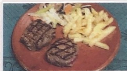
Solomillo Sirloin Kalbsschnitzel € 15,90