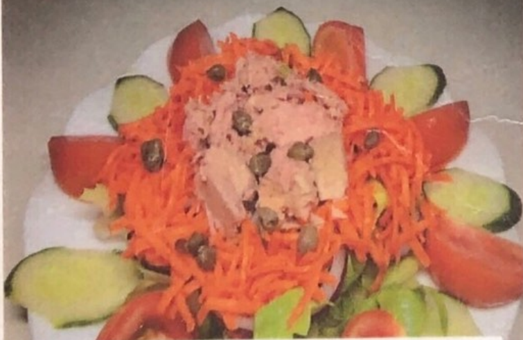
Ensalada Mixta con Atun 7,50 Mixed salad with tuna 1/2=5,50 Gemischter Salat mit Thunfisch