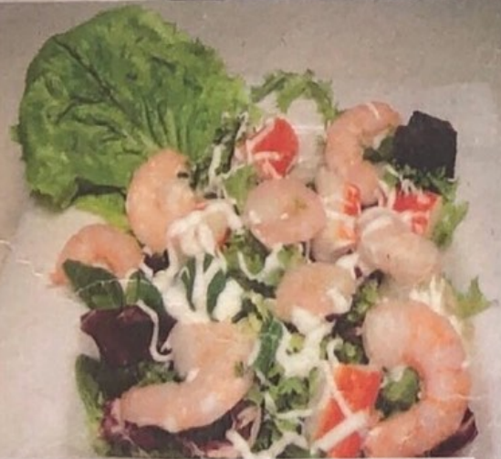
Ensalada de Gambas 8,50€ Prawns salad 1/2=6,50€ Garnelen-salat