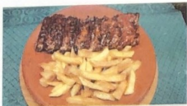
Costilla de Cerdo Pork Ribs Schweinefleisch Ripe