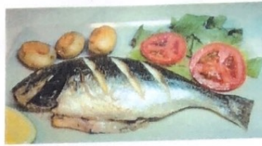
Dorada Golden fish Goldener Fisch € 12,50