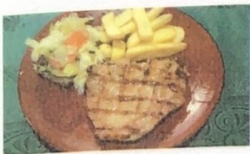
Lomo de Cerdo Pork Loin Schweinekotelet