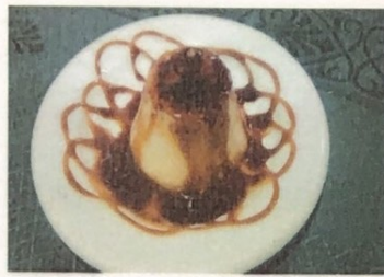
Flan Egg Custard Eierpudding