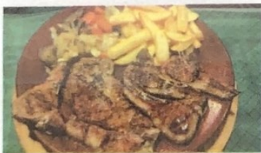
Chuletas de Cordero Lamb Chops Lammkotelett