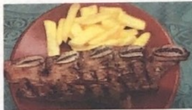
Asado de Tira Beef Rib Rindfleisch Rippe € 13,90