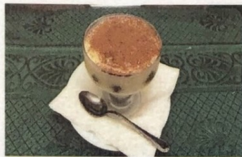
Tiramisú Tiramisu Tiramisu