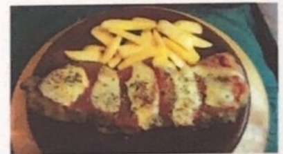
Milanesa a la Napolitana Milanese Napolitan Milanese Neapolitanischen € 13,90