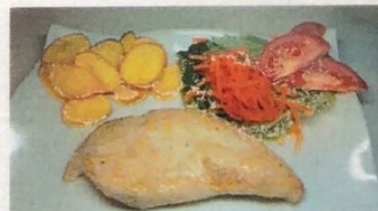
Pechuga al Grill Chicken Breast Hühnerbrust