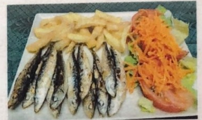
Sardinas al Grill Grilled Sardines Gegrillte Sardinen € 7,50