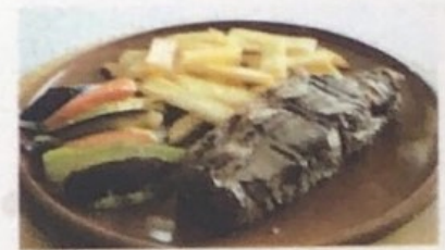
Vacío Argentino Flank Dünnung \frac{1}{2} € 7,90 € 13,90