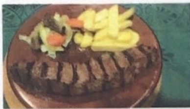
Cuadril Rump Hüftknochen € 13,90