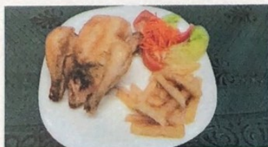
Pollo coquelet Chicken coquelet Hühnchen-Coquelet