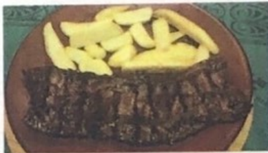
Entraña Thik Skirt Steak Kuh Zwerchfell € 13,90