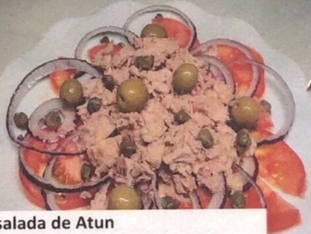
Ensalada de Atun 7,90€ Tuna Salad 1/2=5,90€ Thunfisch-Salat