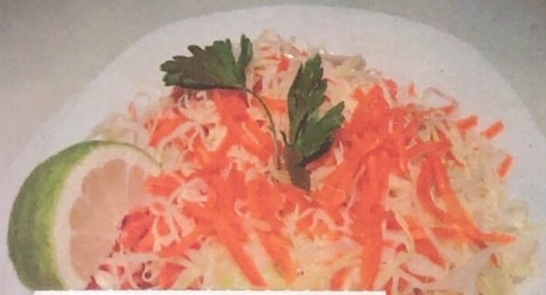
Ensalada de Col y Zanahoria 6,00€ Cabbage and Carrot Salad 1/2=4,00€ Kohl und Karotten-Salat