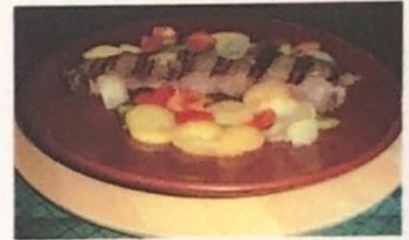
Bife a la Criolla Creole Steak Kreolisches Steak € 13,90