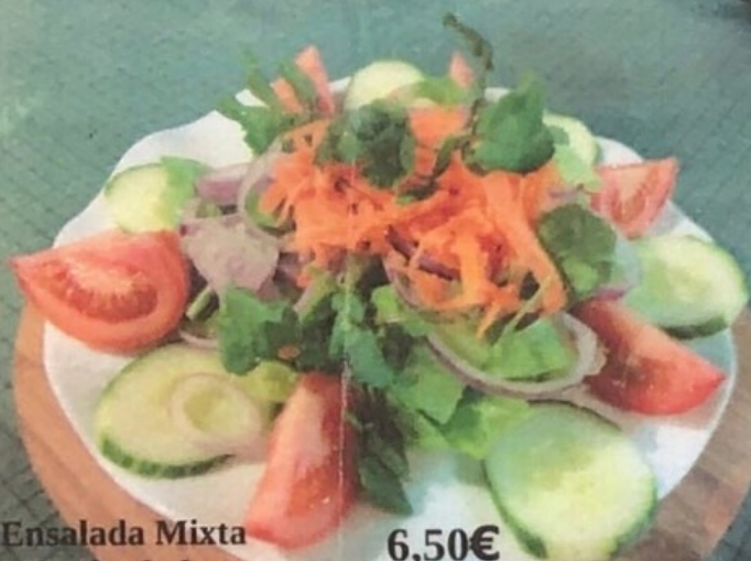
Ensalada Mixta 6,50€ Mixed salad 1/2=4,50€ Gemischter Salat