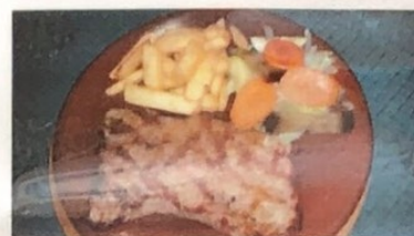
Secreto Ibérico Iberian Secret Iberische Geheimnis