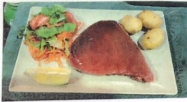
Atún al Grill Grilled Tuna Gegrillter Thunfisch € 12,00