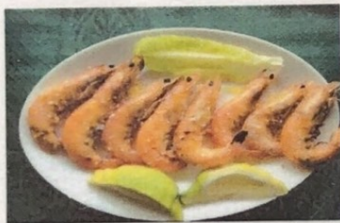
Langostinos Prawns Garnelen € 12,00