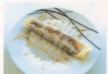
Panqueque Pancake Pfannkuchen