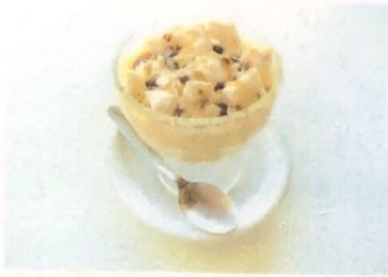
Polvito Uruguayo Uruguayan Powder Uruguavisches Pilver