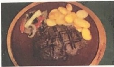
Bife Ancho Special Steak House Besonderes Steakhaus €13,90