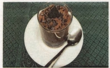
Mousse de Chocolate Chocolate mousse Schokoladencreme