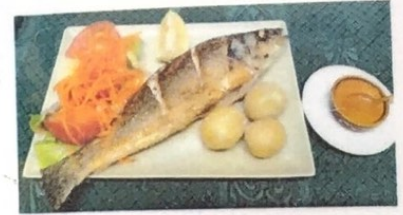
Lubina Sea Bass Fish Wolfsbarsch Fisch € 12,50