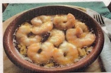
Gambas al Ajillo Shrimp Scampi Knoblauchgarnelen € 10,00